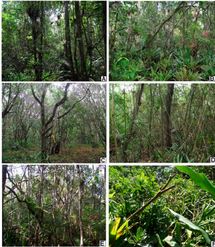
Fig. 2. Vista geral das fitofisionomias amostradas do Parque Estadual Acaraí. Floresta de Alta Restinga Seca (ARS) (A), Floresta de Alta Restinga Hidromórfica (ARH) (B), Floresta de Baixa Restinga (BR) (C), Floresta de Alta Restinga Seca Degradada (ARSD) (D), Floresta de Alta Restinga Hidromórfica Degradada (ARHD) (E e F) e a Zona de Transição entre BR e ARH. ARSD demonstrando o sub-bosque dominado principalmente por taquaras, Meros tachys sp., e com a presença de alguns indivíduos de Pinus sp. (D). ARHD com sub-bosque aberto com altas densidades de Tibouchina sp. (jacatirão ou manacá da serra) (E) ou Hedychium coronarium (lírio do brejo) (F).

A menor riqueza ocorreu no ARSD, com uma espécie, seguido de BR, com duas espécies. No verão não houve capturas em ARSD, ARHD e ZT. É importante destacar que cada tipo de vegetação possui um número